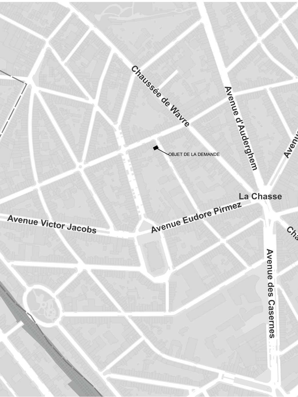
Plan de Localisation 1/5000