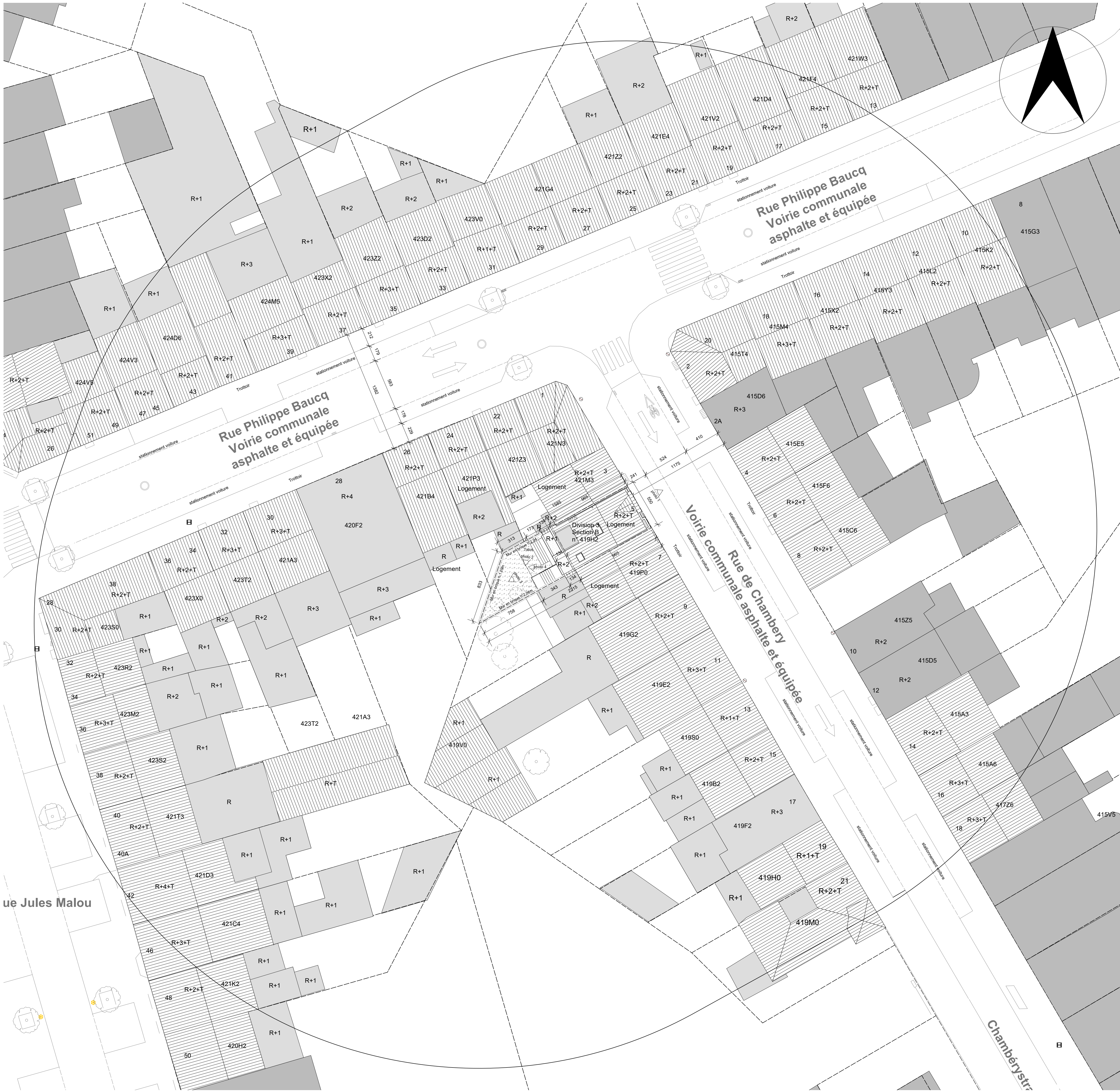
Plan de Implantation 1/200 (situation de projetée)